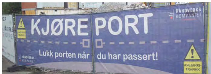
Her er dekkduker satt på kjøreport. Dette viser tydelig hvor innkjøring til byggeplassen er.