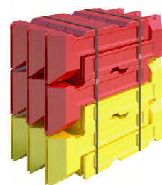
9 komplette sett pr. pall

De fyllbare fundamentene har blitt testet til å tåle en vindstyrke på opptil 25 m/s. Dette er unikt, tatt i betraktning bredden som kun er på 38 cm. Ved å benytte slike fundament, har man en løsning som utnytter den tilgjengelige plassen maksimalt. Gjerdelinjen blir svært stabil og man eliminerer snublefare som er ved bruk av føtter og evt. støttestag. Spesielt på byggeplasser langs vei/fortau, og ellers der man ønsker ekstra god sikring, er dette et godt alternativ. Fundamentene kan fylles med vann eller sand. Vekt pr. to enheter når fylt opp, er 320 kg. Standardfarger er gult og rødt, men de kan leveres i den fargen man ønsker. Kan kombineres med refleks og lys for ekstra synlighet.