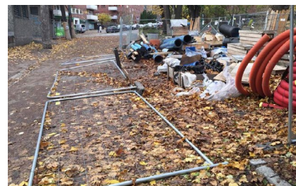
Eksempel der sikringen har vært mangelfull. Gjerdene kunne forårsaket skade på mennesker og kjøretøy, og området har i tillegg blitt stående usikret i en periode.