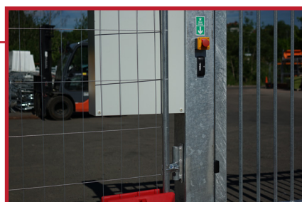
Porten leveres med innfesting for byggegjerder. Nødstopp både på inn- og utside av porten.