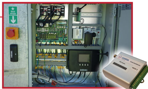
Oversiktlig kontrollskap inkludert Garda SmartService - GSS styringsenhet for full kontroll på installasjonen via skyløsning.

Art.nr. 3331 Håndsender Art.nr. 1535 Kodetablå Art.nr. 3101 Infobric HMS-kortleser Art.nr. 1077 PVC varslingsduk (valgfritt trykk) Kortlesersøyle m/fot