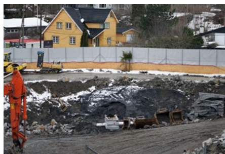
Lydabsorberende duker rundt byggeplassen.