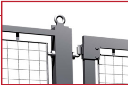
Løfting gjør det enkelt å flytte porten. Øyebolt M24. Hengsler M24.