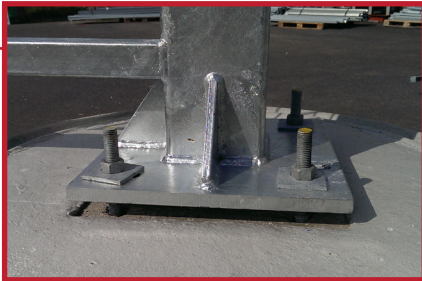
Stolper med fotplate. Festes til betongfundament. Anbefalt mål på fundament: Ø1000 x H: 500 mm