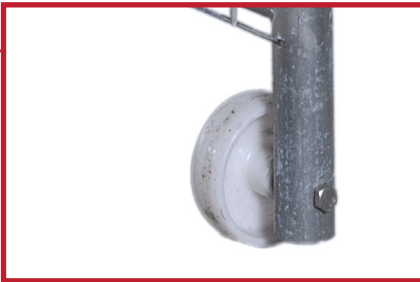
Hjulet gjør det enkelt å åpne og lukke porten.