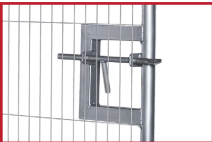
Porten er utstyrt med låsepinne for enkel og effektiv stenging med hengelås.