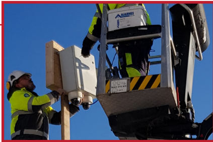
Kameraskap monteres på egnet sted som gir god oversikt over området som ønskes overvåkes.