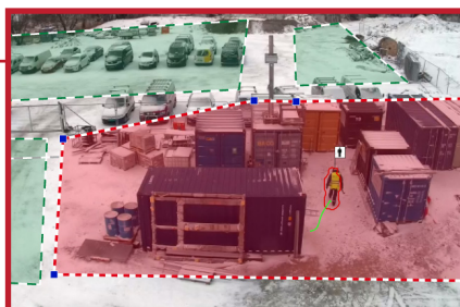
Områder defineres som skal gi varslning om uønsket adferd (IVA).

Pakken inkluderer i tillegg antenne, ruter, switch og varmeelement. Ta kontakt for mer detaljert informasjon på teknisk beskrivelse av kamera, høyttaler og annet utstyr i løsningen.