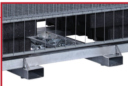
Spor til gaffeltruck både på kort- og langsider gjør det raskt og enkelt å laste og losse.

KP30 rommer 26 stk av Smartpanel byggegjerder med avrundet topp.