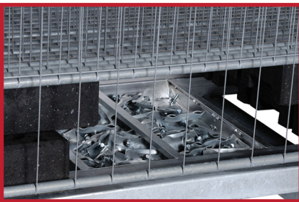
Plass til både 30 føtter og klammere.