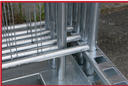
Gjerdene settes ned i firkantede rammer. Gjør det lett å plassere gjerdene i pallen, selv om det skulle være skade på rør-enderne.

NB! Denne pallen tar ikke føtter/tilbehør. Dette leveres på vanlig europall ved siden av.