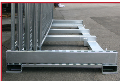
Spor til gaffeltruck både på kort- og langsider gir rask og enkel lasting/lossing.