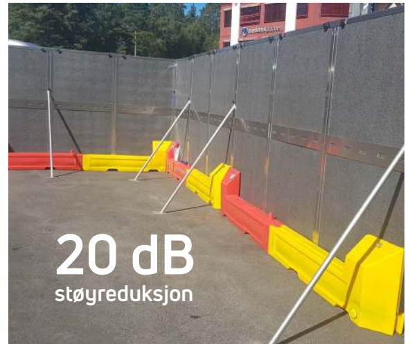
Under design-registrering no 20200851