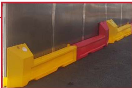
Platene er tilpasset bredden på vektblokker, med plass til 3 plater pr komplett vektblokk-element (3,5 meter)