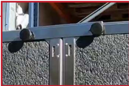
Panelene festes enkelt sammen i toppen med en kobling. Eneste nødvendige tilbehøret for å montere platene i vektblokkene.